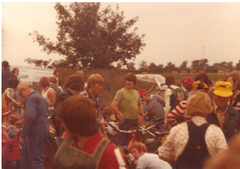
Trængsel og travlhed i ryttergården.

Af og til blev løbene arrangeret af Den Fynske Løbssammenslutning, hvori Motorklubben Vestfyn og Bogense Motorklub var med.