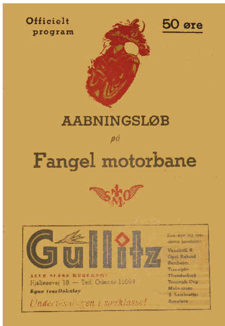
Programmet fra genåbningen d. 1. August 1954

At banen havde været savnet i den lukkede periode kunne ses på tilskuertallet. Der gik 10.000 gennem tælleapparaterne.