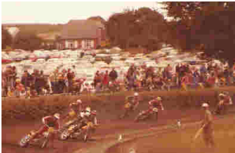
8 køreres trængsel i første sving