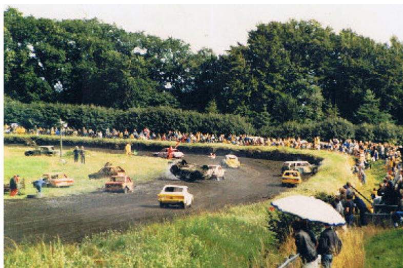
Det formentlig sidste race på Fangelbanen..

Banen fortsatte derefter 1 - 2 gange om året med billøb, autocross og folkerace og endte med stock car løb. (Banger race). Den 4. September 1994 kørtes for allersidste gang på banen.